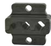
ZAE5072 İkiz Yüksükler için 2x6 - 2x16 mm 2