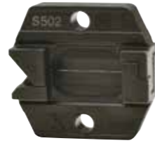
S502 Kesme Seti

Yeni S502 kesme aparatı sayesinde Klauke micro yepyeni bir boyut kazanıyor. Basit bir aparat değişikliği ile Klauke micro'yu bir kesme aracına dönüştürmek mümkün. Böylece düğüm zincirlerini, 2 ila 25 mm 2 kablo sınıfını, 3 mm x 10 mm'ye kadar bakır şeritleri veya 3 mm'ye kadar çelik halatları kesmek mümkün hale geliyor.