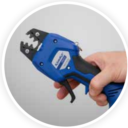
Her zaman kullanıma hazır