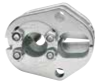
SD5016 16 mm 2 iletkenler