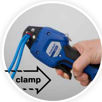
Ön sıkma işlevi el ile