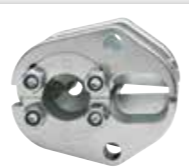
SD5006 6mm 2 lik iletken (opsiyonel) Sevk kapsamında değildir