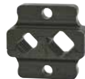
AE5073 Yüksükler için 35 - 50 mm 2