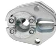
SD5025 f25 mm 2 iletkenler