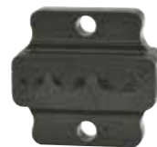
AE5071 Yüksükler için 0,5 - 6 mm 2