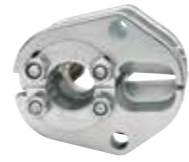
SD5035 35 mm 2 iletkenler