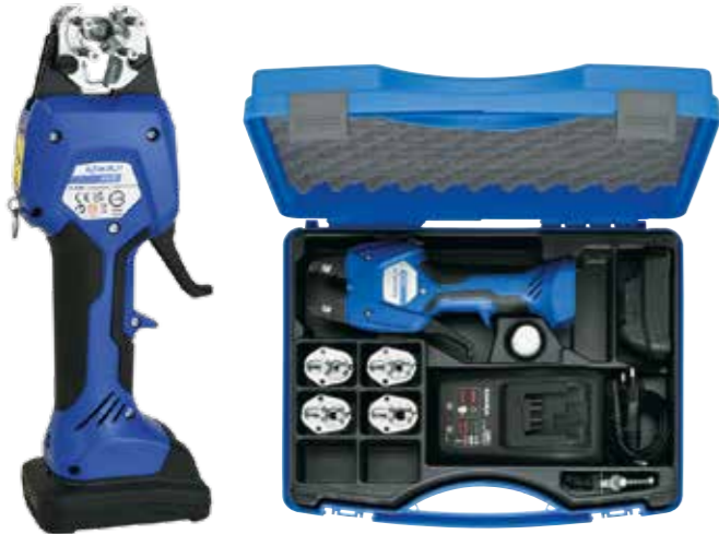
EKSD50ML SEVK KAPSAMI