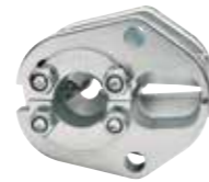
SD5010 10 mm 2 iletkenler