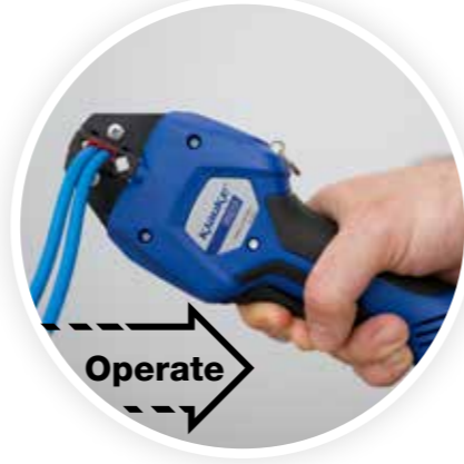
Sıyırma / Sıkma Kesme motorlu biçimde sağlanır