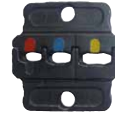
IS5071 İzolasyonlu birleştirmeler için 0,5 - 6 mm 2