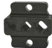
AE5072 Yüksükler için 10 - 25 mm 2