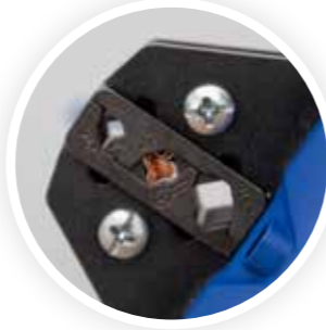
En iyi krimp/sıkma sonuçları

Klauke mikro'yu bu kadar benzersiz kılan şey, PowerSense fonksiyonuna sahip yenilikçi kullanım konseptidir. Bu işlev, mekanik krimp/sıkma penselerinin alışılmış hassasiyeti ve hızıyla elle ön sıkıştırma sağlar. Soyma, kesme veya krimp/sıkma işlemi, entegre motorun gücüyle tamamen otomatik olarak gerçekleşir.